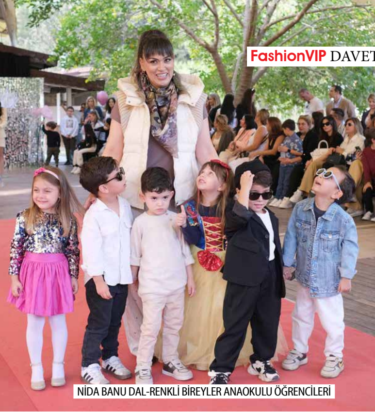
NIDA BANU DAL-RENKLİ BİREYLER ANAOKULU ÖĞRENCİLERİ