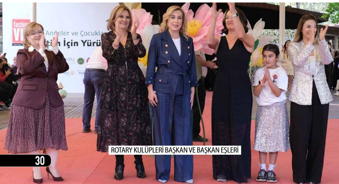
ROTARY KULÜPLERİ BAŞKAN VE BAŞKAN EŞLERİ